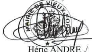
Héric ANDRE ./

Pour avis conforme Le Trésorier municipal